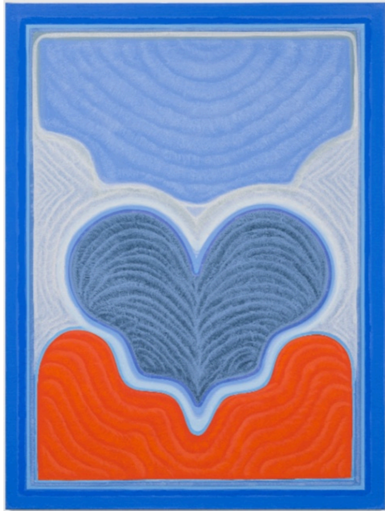
Clouds Over Vetheuil © Lily Stockman

In partnership with MASSIMODECARLO gallery, Fondation Le Corbusier is presenting the first European exhibition by American artist Lily Stockman. Minotaur is inspired by the bull motif in Le Corbusier's paintings.