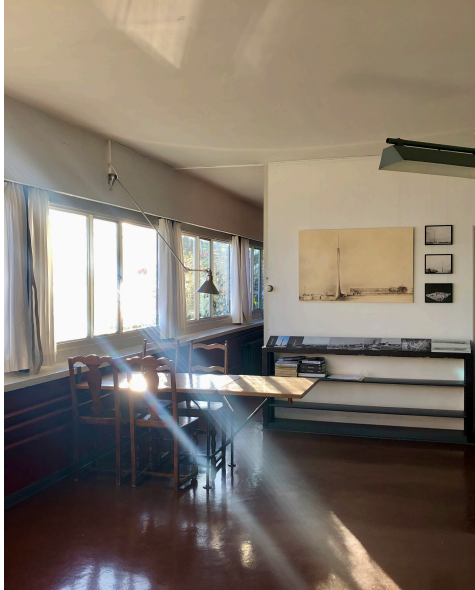
Villa « Le Lac »