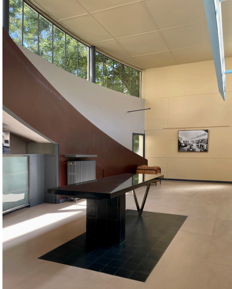
Maison La Roche