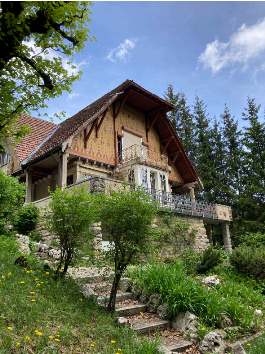
Villa Fallet

VILLA FALLET — LA CHAUX-DE-FONDS - SUISSE