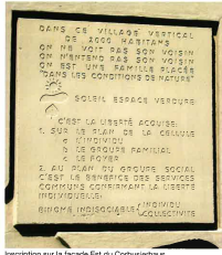
Inscription sur la façade Est du Corbusierhaus